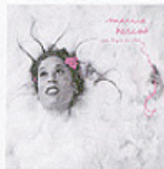
Marine Bercot : Ma Langue au chat ★★★ (Le Chant du monde)